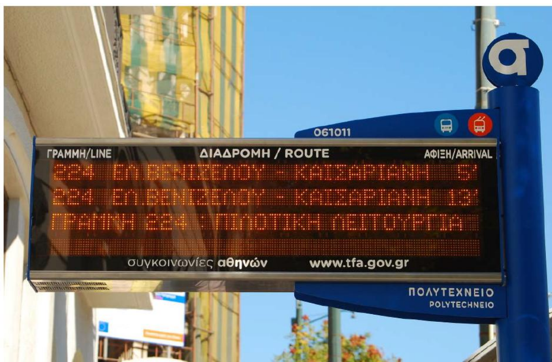
Οθόνη πληροφόρησης σε στάση

Το έργο περιλαμβάνει την εγκατάσταση ενός δικτύου 1.000 «έξυπνων» στάσεων σε όλη την περιοχή αρμοδιότητας του ΟΑΣΑ. Η επιλογή των στάσεων έγινε από τον ΟΑΣΑ με γνώμονα την επιβατική κίνηση των διερχόμενων από τις στάσεις γραμμών καθώς και τον καταμερισμό αυτών σε όλους τους Δήμους που εκτελούνται δρομολόγια των αστικών συγκοινωνιών.